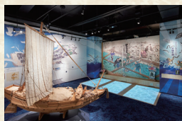
北前船模型（兵庫津ミュージアム）