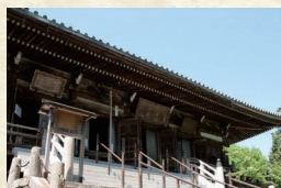
清水寺大講堂（加東市）