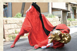
千谷麒麟獅子舞（新温泉町）