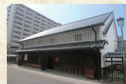
旧岡田家住宅（伊丹市）