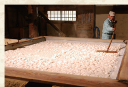
赤穂の塩づくり（赤穂市）