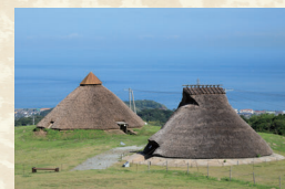
五斗長垣内遺跡（淡路市）