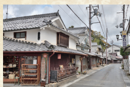
丹波篠山の街並（丹波篠山市）