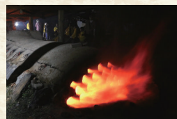
丹波立杭の登窯（丹波篠山市）